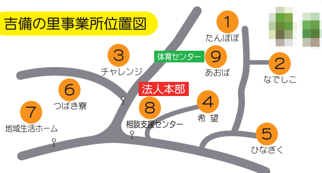
吉備の里事業所位置図

当法人は、自然そして多くの社会資源を最大限に活かしたカリキュラムを実践し、“利用者にいつまでも健康で生活してほしい”を基本に、「日中活動」「余暇」「食事」「健康」面について家庭的な現場で支えます。