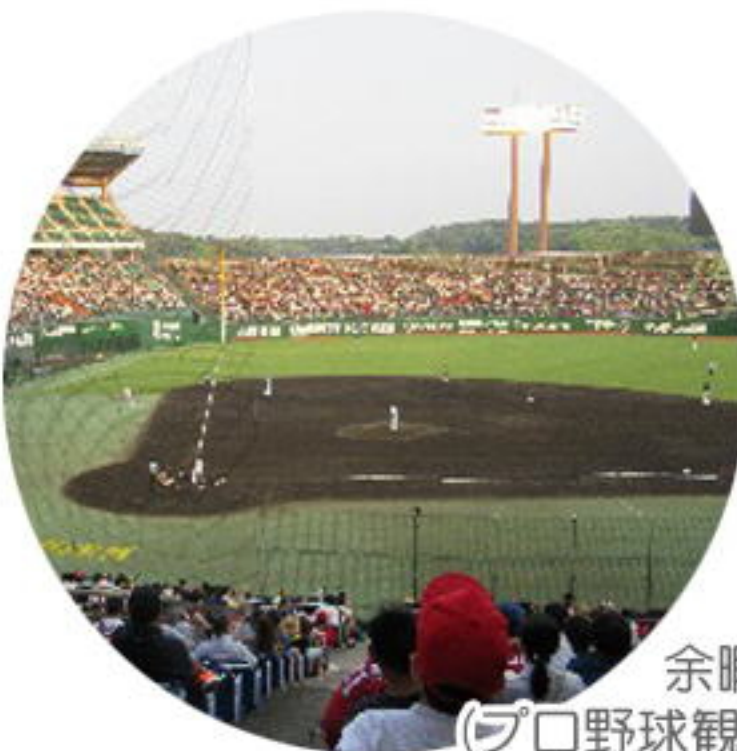
余暇 (プロ野球観戦)