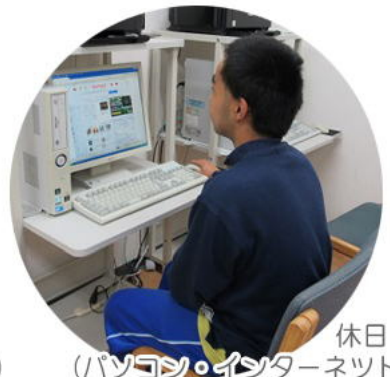
休日 (パソコン・インターネット)