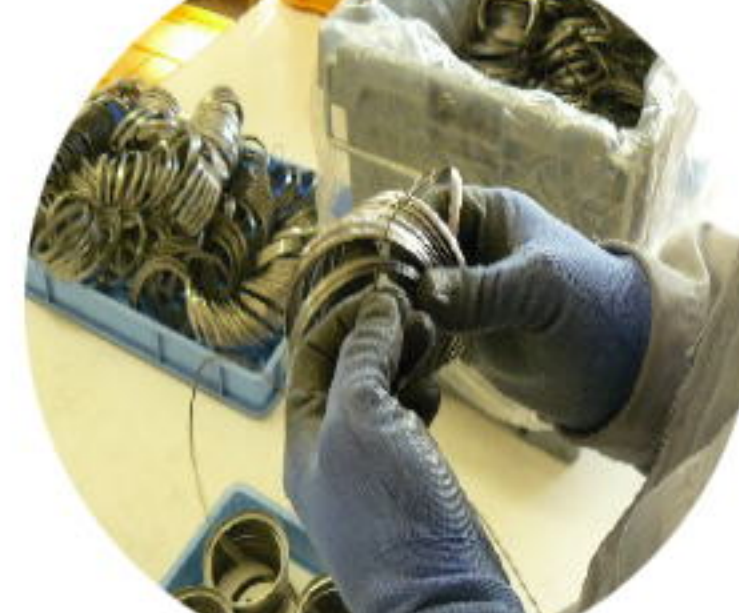
作業訓練(簡易作業)