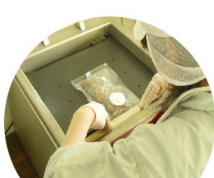
作業訓練(食品加工)