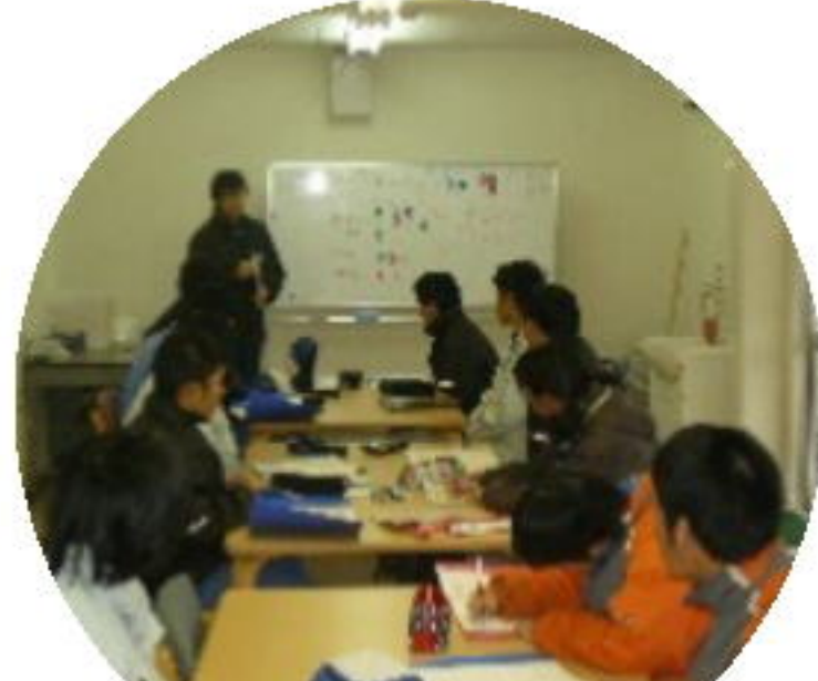
朝のミーティング

相談及び援助・施設内作業訓練・職場実習・求職活動 健康管理支援・食事提供・その他