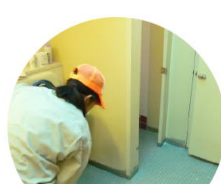
作業訓練(清掃作業)